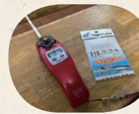
これがワカサギ釣りに使う釣り竿とエサ。

HPで営業日・時間を確認。ドーム船に乗れる人数は限られているので、必ず予約を。道具のレンタルについても確認しておいて。